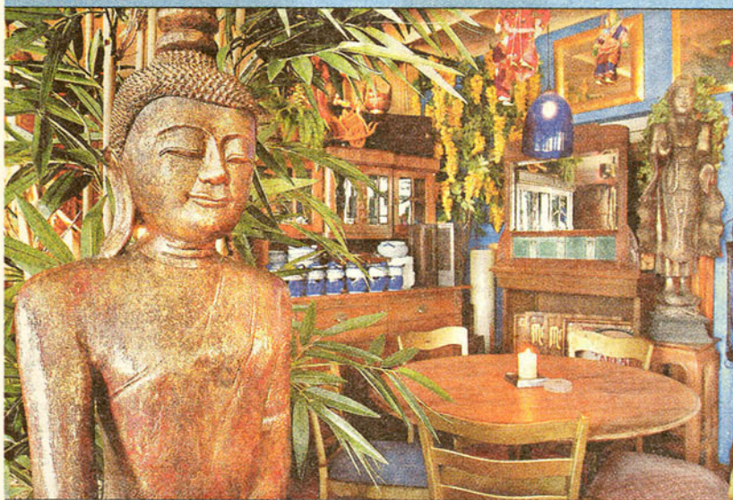
Bietet kulinarische Erleuchtung mit thailändischen Spezialitäten: Das Restaurant Bababobo.